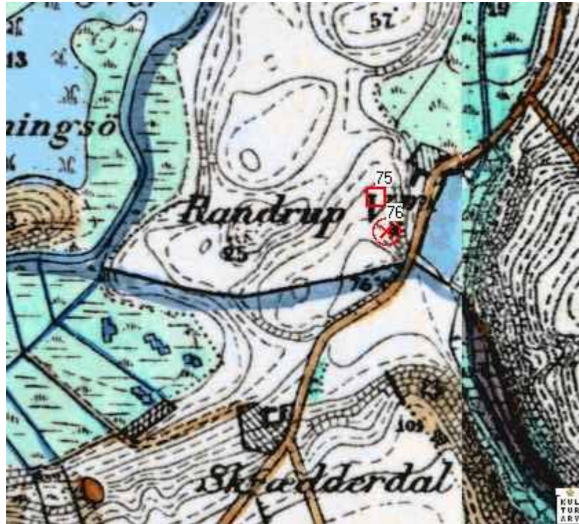
Figur 1: Stedet, hvor hallen skulle bygges, og hvor der fandtes en hustomt er markeret med rød firkant (75).