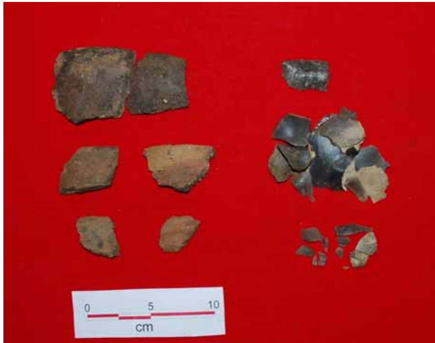
Figur 4. Fund fra fyldlagene i forsænkningen. Lerkarskåret nederst tv. har to kornindtryk.

Der blev gjort en del fund (figur 4) i forsænkningen. De fleste fund var mindre lerkarskår, hvoraf nogle randskår. Ingen skår var ornamenterede bortset fra et enkelt sideskår, hvor der ses vandrette omløbende brede furer. Det blev også fundet en del flintafslag, de fleste ganske små. De viser, at man vel i begrænset grad har hugget flint på bopladsen. Der blev fundet et enkelt stykke af en parallelhugget, formodet dolk, der især på den ene side er ildskørnet. Ser man på stykket af dolken, så ligner den meget den hele flintdolk museet tidligere fik indleveret (figur 2). Ligheden er faktisk så stor, at der sagtens kunne være tale om to flintdolke fra samme tid, og det er da fristende at foreslå, at det kan være den samme flintsmed, der har lavet begge dolke.