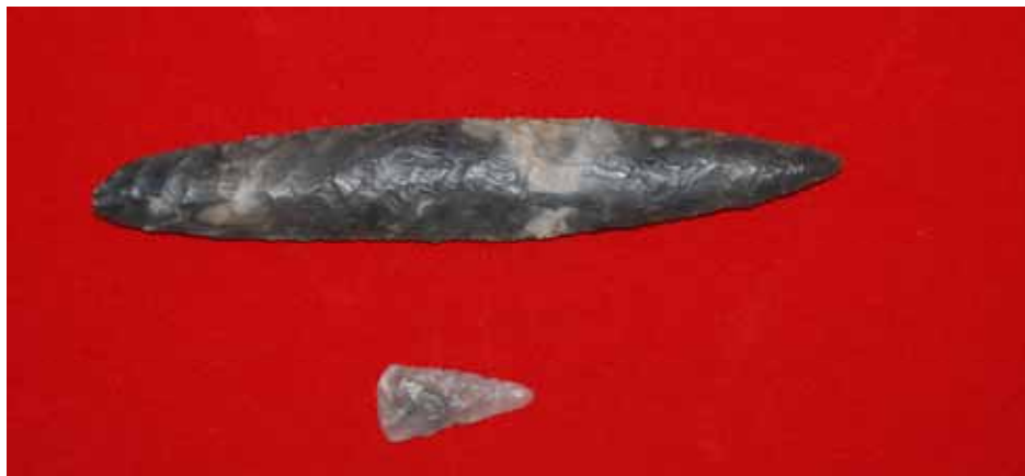
Fig.2. Fladehugget dolk og pilespids indleveret til museet i 1898

Der var ikke tidligere registreret fortidsminder på stedet, hvor hallen skulle placeres. Dog fik museet i 1898 en fladehugget lancetformet dolk og en fladehugget pilespids (figur 2), hvor fundstedet er angivet som Randrup Mølle, (DKC-130716-76). Deres bevaringstilstand taget i betragtning stammer de sandsynligvis fra en senneolitiske grav (SN I).