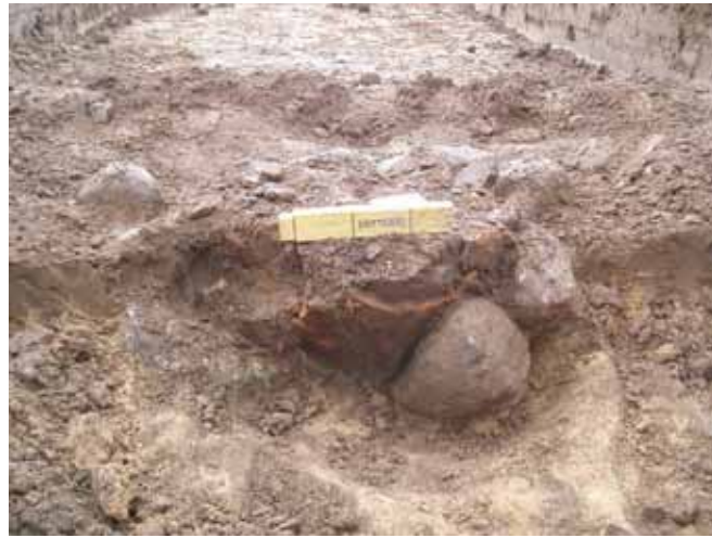
Figur 4. Den stenomsatte urnegrav under udgravning.

Den anden brandgrav var mere simpel. I en langstrakt fordybning fandtes lidt brændte ben blandt håndstore sten (figur 5). Toppen af denne grav er givetvis også blevet bortpløjet. Der blev her fundet så få brændte ben, at det er tvivlsomt om den dødes køn og alder kan bestemmes. Heller ikke den grav indeholdt gravgaver.