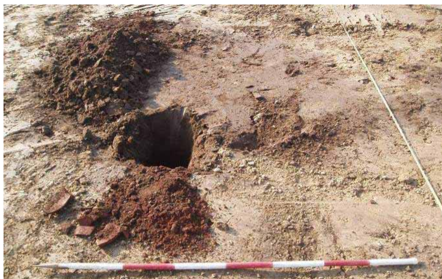
Figur 7. Skovlgravet hul i kanten af den næsten 2m store grube K17. Bemærk den rustrøde formodede tørveaske og lerkarskårene, som formodentlig er husholdningsaffald, der er brugt til at fylde hullet op med.

I den sydlige del af området fandtes hverken brandgrave eller de ovennævnte anlæg med trækul. Her var der til gengæld spredt liggende 'gruber'. Man har her gravet flere større huller, formodentlig fordi man har skullet brugeler, måske til husgulve eller til lerklining på husvæggene. Vi brugte ikke meget tid på at undersøge disse gruber, men i en af gruberne fremkom adskillige lerkarskår og rustrød aske (figur 7). Rød aske kan stamme fra tørv, så måske har man af og til fyret med tørv, som man har hentet i en nærliggende mose.