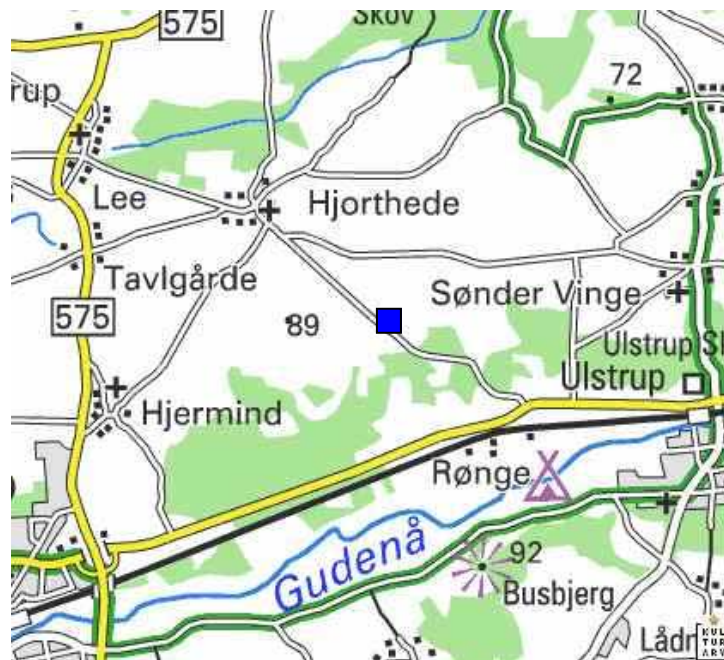
Figur 1. Rugballegårds placering.

Den nye stald skulle placeres på marken lige øst for de eksisterende bygninger (figur 2).