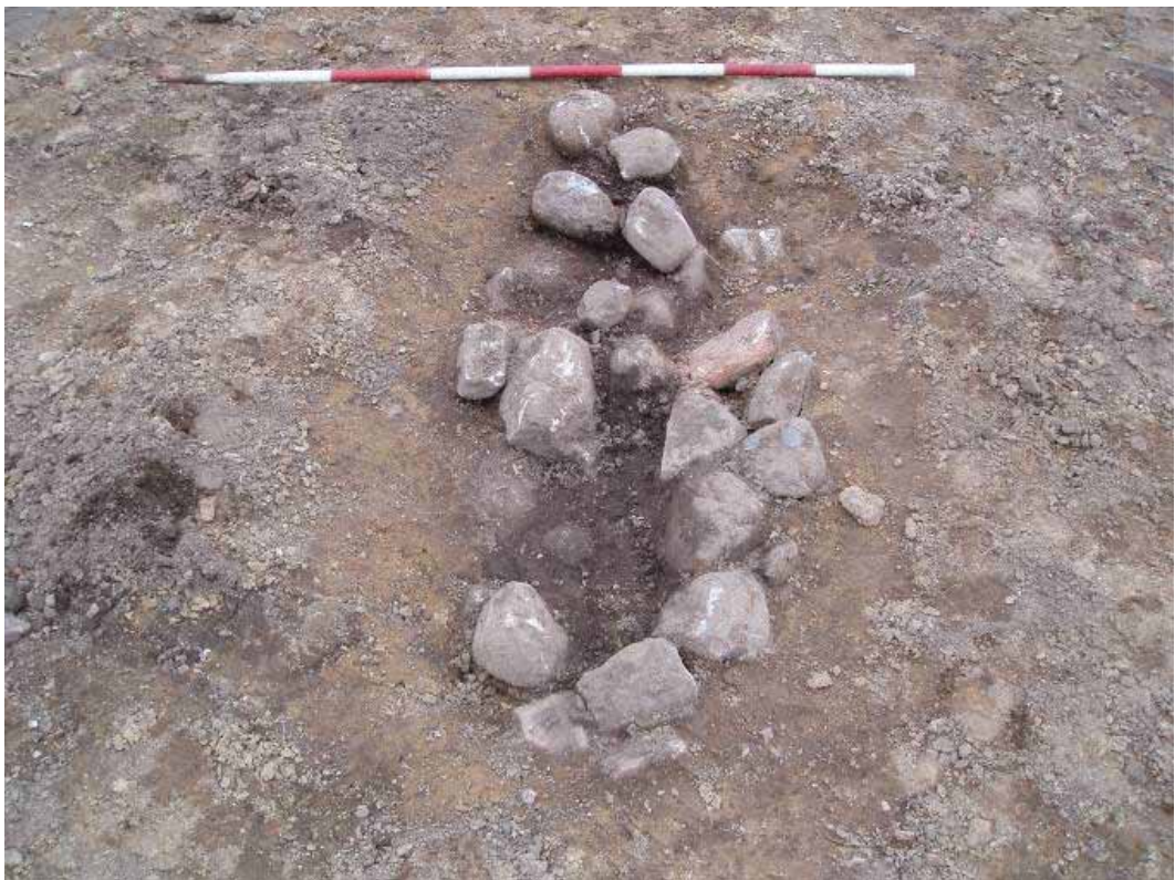
Figur 5. Simpel brandgrav med sten.

I den nordlige del blev også fundet 9 'pletter' med en del trækul. En af disse var helt flad og under et trækulslag kunne ses en svag rødfarvning af undergrunden (figur 6).