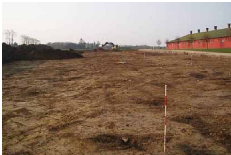
Figur 2. Udgravningsfeltet efter muldafrømning. Til højre en ældre stald.

Den nye stald skulle placeres på marken lige øst for de eksisterende bygninger (figur 2).