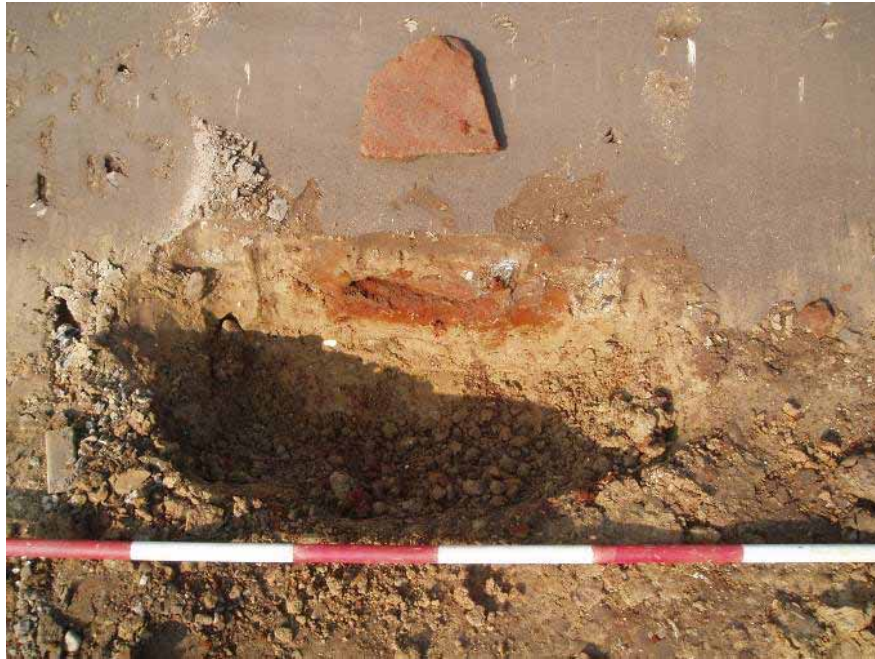
Figur 8. Grube K44 snittet i kant af udgravningsfelt.

Resterne af knuste lerkar fra råstofgruberne kan dateres til den ældste del af førromersk jernalder, ca. 550-300 f. Kr. Det samme gælder formodentlig urnegraven, om end det ikke kan udelukkes, at den er fra den allersidste del af bronzealderen (600-550 f. Kr.). Ingen fund kan dateres til andre dele af oldtiden, og det er vurderingen, at alle anlægssporene i det undersøgte område er fra omtrent samme tid.