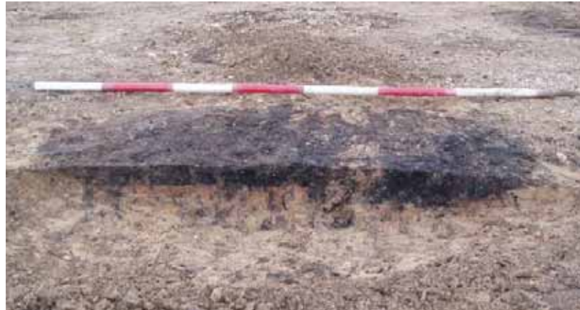
Figur 6. Anlæg K30 i snit. Bemærk rødfarvningen under trækullaget.

I den sydlige del af området fandtes hverken brandgrave eller de ovennævnte anlæg med trækul. Her var der til gengæld spredt liggende 'gruber'. Man har her gravet flere større huller, formodentlig fordi man har skullet brugeler, måske til husgulve eller til lerklining på husvæggene. Vi brugte ikke meget tid på at undersøge disse gruber, men i en af gruberne fremkom adskillige lerkarskår og rustrød aske (figur 7). Rød aske kan stamme fra tørv, så måske har man af og til fyret med tørv, som man har hentet i en nærliggende mose.