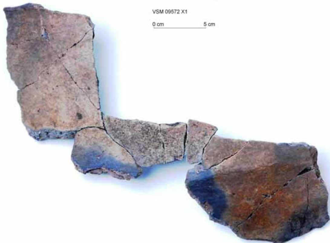
Figur 5. De sammenføjede lerkarskår fra et stort dobbeltkonisk lerkar fra første halvdel af yngre bronzealder. Fundet i ild-/kogegruben A60.

Efter alt at dømme har undersøgelsen afdækket langt hovedparten af aktivitetsområdet på bunden af slugten ved Hjarbækvej. Således afgrænses det mod nord og vest af de stejle skrånninger og ikke mindst det våd-/engområde, der sikkert også langt tilbage i tiden har strakt sig ind i slugten fra vest og helt ind til aktivitetsområdet. Afgrænsningen mod syd og øst kan ikke fastlægges helt så sikkert, men eftersom søgegrøfterne syd og øst for udgravningsfeltet ikke indeholder spor efter tilsvarende aktiviteter synes det rimeligt at formode, at aktivitetsområdet ikke har strakt sig meget længere i disse retninger.