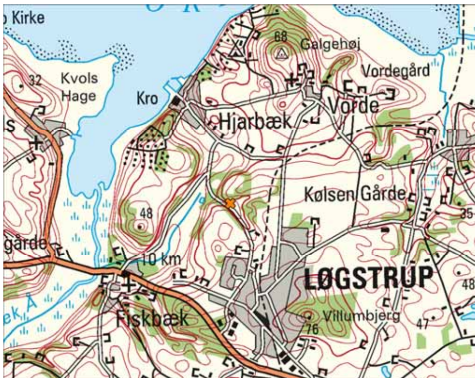
Figur 1. Den orange markering viser placeringen af udgravningen "Hjarbækvej" i 2009.

Lokaliteten Hjarbækvej ligger nordvest for Viborg mellem Løgstrup og Hjarbæk. Her løber tre markante slugter sammen i én slugt, der fortsætter ud Ørregård Mose og dalen nordøst for Fiskbæk (se Figur 1, Figur 2).