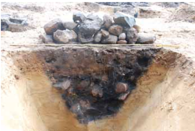
Figur 3. Snit gennem en typisk ild-/kogegrube (A60). Gruben måler 69 cm i dybden og 98 cm i bredden. Nederst ses et gråsort trækulsholdigt lag med mange, tætpakkede hånd- og hovedstore ildskørnede sten (de ildskørnede sten, som blev frilagte ved snittet af gruben, er lagt i bunken ovenpå gruben). Øverst i gruben ses et mørkt gråbrunt lag, der stammer fra opfyldningen af gruben efter brug.

"Ild-/kogegruber" kaldes også jordovne, eftersom de generelt formodes at have været brugt til madlavning. De er kendetegnet ved, at der i bunden findes et sort trækulsholdigt askelag. Det viser, at der har været ild i gruben, og at der i eller over dette askelag findes skørbrændte sten, som må være opvarmet i gruben. "Kogegruber" er kendetegnet ved, at de kun indeholder skørbrændte sten, men ikke noget trækulsholdigt lag. Disse sten må altså være blevet opvarmet et andet sted, eksempelvis i en ild-/kogegrube eller et ildsted. "Ildgruber" er kendetegnet ved, at de kun indeholder et trækulsholdigt eller trækulsfarvet lag, men ingen skørbrændte sten eller spor heraf.