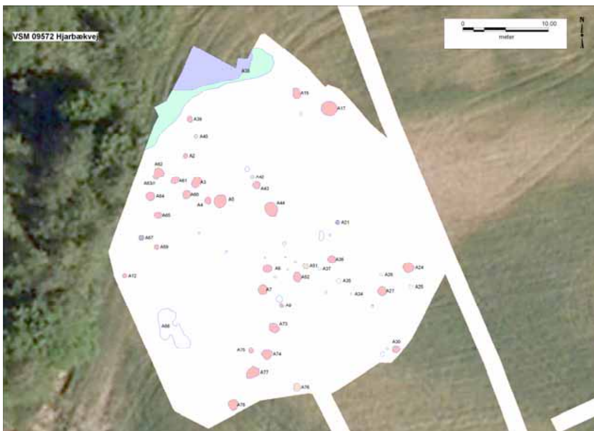
Figur 4. Oversigtsplan med angivelse af udgravningsfeltet samt tilstødende dele af forundersøgelsens søgegrøfter. Med rød krydskravering er markeret 29 ild-/kogegruber, med brun krydskravering er markeret 4 kogegruber og med sort krydskravering er markeret 3 mulige ildgruber. Med lyseblå og lilla farve er markeret spor efter tidligere våd/engområde, der skal ses i sammenhæng med det eksisterende, langstrakte våd/engområde i slutten mod vest.

Der blev sammenlagt fundet flere tætliggende klynger af uorganiserede kogegruber, ildgruber og især ild-/kogegruber indenfor et forholdsvis lille område, hvor der ikke blev fundet spor efter bebyggelse. Hermed adskiller gruberne fundet ved Hjarbækvej sig afgørende fra de spredte ild-/kogegruber og dens varianter, som er velkendte fra adskillige undersøgelser af bebyggelser fra ældre bronzealder til ind i germansk jernalder (1800 f.Kr. - 500 e.Kr.). I stedet knytter ild-/kogegruberne fra Hjarbækvej sig til en særlig gruppe af formodede samlingspladser. Det er lokaliteter med med større eller mindre samlinger af ild-/kogegruber. De kan som ved Hjarbækvej - rumme adskillige uorganiserede ild-/kogegruber i større eller mindre koncentrationer, eller de kan have ild-/kogegruberne organiserede som perler på en snor i en eller flere rækker.