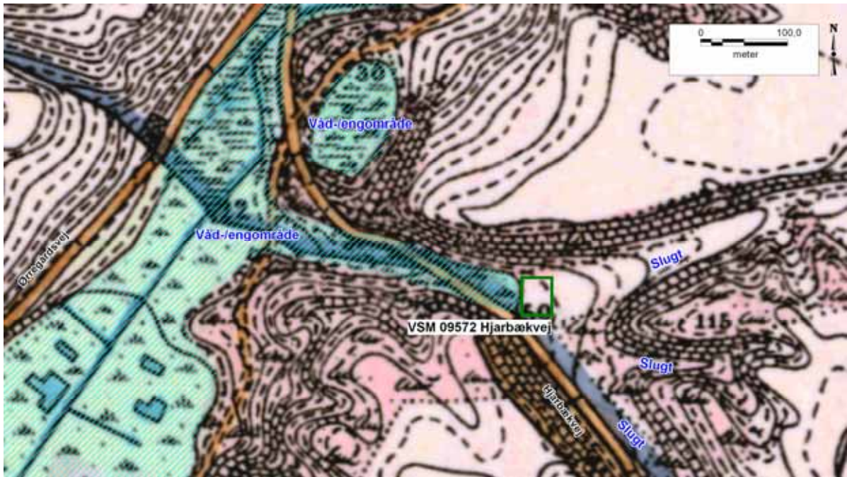
Figur 2. Det berørte område (markeret med grøn firkant) er beliggende lavt i terrænet hvor tre meget markante slugter løber sammen i én slugt med vestlig orientering. Umiddelbart vest for sammenløbet af de tre slugter er bunden af slugten præget af et lavtliggende våd-/engområde (markeret med lyseblå skråskravering), som har direkte forbindelse med det store våd-/engområde, Ørregård Mose, i dalen nordøst for Fiskbæk. Ørregård, som er beliggende i landsbyen Fiskbæk (se Figur 7), blev tidligere stavet "Ørredgård", hvilket givetvis henviser til, at den tidligere har haft ret til at afspærre en eller begge de nærliggende åer og opfiske laks, havørred og ål. Baggrundskort er det høje målebordsblad fra anden halvdel af 1800-tallet.